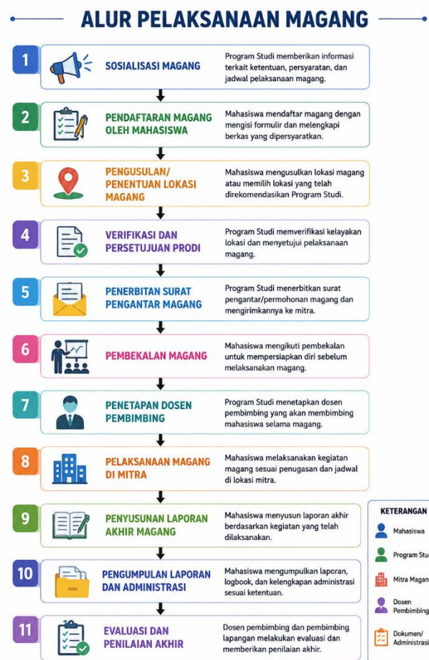
Gambar 1. Bagan Pelaksanaan Magang